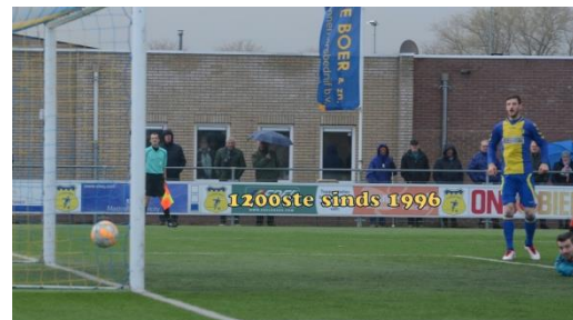
1200 ste doelpunt sinds 1996-1997