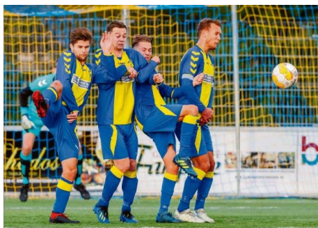
Een muurtje van Olde Veste-spelers ziet de bal aan komen vliegen.

STEENWIJK - Gezien het spel en de kansen was een gelijkspel bij de wedstrijd tussen d'Olde Veste'54 en het bezoekende PKC'83 uit Groningen wel terecht. Halverwege was het 0-0. De blauw-gelen kwamen een kwartier voor tijd op een 1-0 voorsprong, maar amper twee minuten later was het ook alweer 1-1.