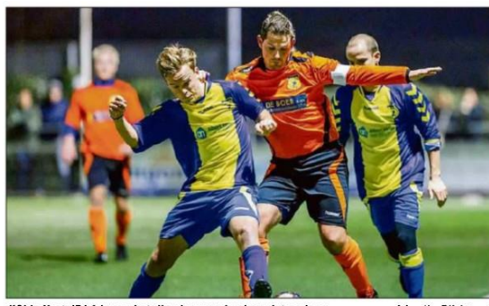
d'Olde Veste'54 1 kreeg het dinsdagavond zeker niet cadeau.