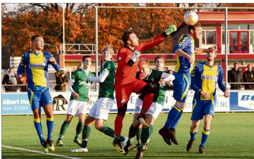
d'Olde Veste '54 was tegen Zeerobben heer en meester.

Dat leek zo vroeg in de wedstrijd al de genadeklap voor de Harlingers die een geknakte indruk maakten.