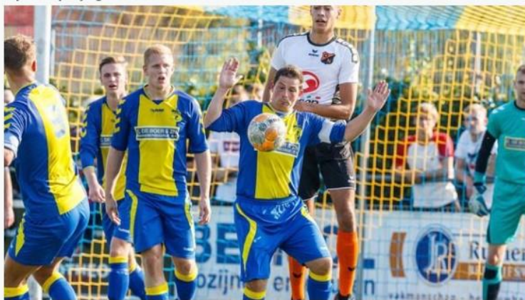
d'Olde Veste'54 hoopt in Groningen weer een driepunten te pakken.

Geplaatst op vrijdag 30 november 2018 13:47