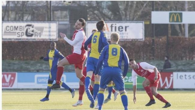
HZVV Olde Veste.

Geplaatst op vrijdag 15 februari 2019 12:30