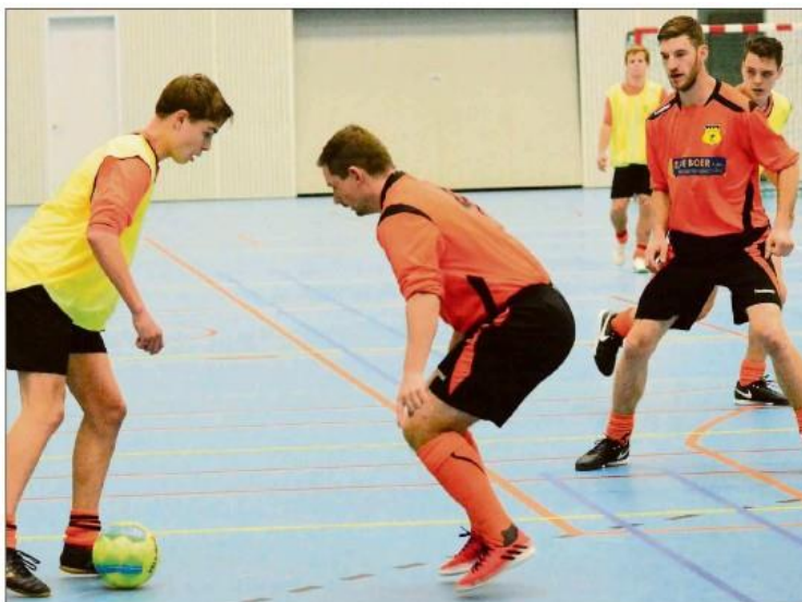
d'Olde Veste'54 plaatste zich donderdag al voor de finale. Hier in duel tegen Oranje Zwart.

Verder mengen ook MSC, Alcides, FC Meppel, Staphorst, Hoogeveen, SC Emmeloord, Wolvega, Avanti en Gieten zich in de strijd om de hoofdprijs in dit prestigieuze toernooi. Nadat d'Olde Veste'54, Oranje Zwart en SVBS'77 donderdag al in actie kwamen, moest Olyphia vrijdagavond proberen een plekje in de eindstrijd te bemachtigen.