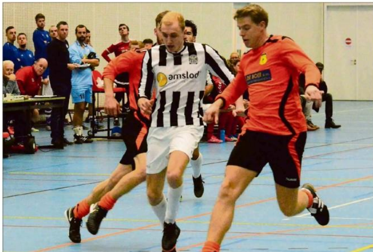
d'Olde Veste'54 kwam uiteindelijk twee goals tekort om MSC uit de halve te houden.