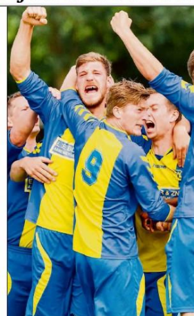
d'Olde Veste'54 speelt de eerste competitiewedstrijd uit tegen 'angstgegner' Noordscheschut.

Hoogeveen / Steenwijk - d'Olde Veste'54 heeft zich voor het nieuwe seizoen versterkt met doelman Luuk Dorland. De sluitpost komt over van hoofdklasser HZVV en is bij de Steenwijkers de beoogde opvolger van Tom Holleboom, die naar Staphorst vertrekt.