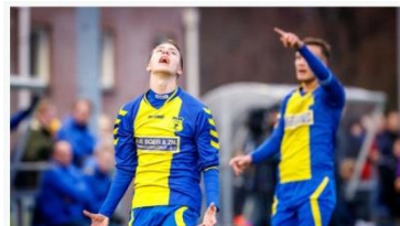
d'Olde Veste'54 ontvangt Broekster Boys Steenwijk - d'Olde Veste'54 heeft goede herinneringen aan Broekster Boys. Uit in Damwoude werd het eerder dit seizoen 0-7. Geplaatst op zaterdag 30 maart 2019 19:27