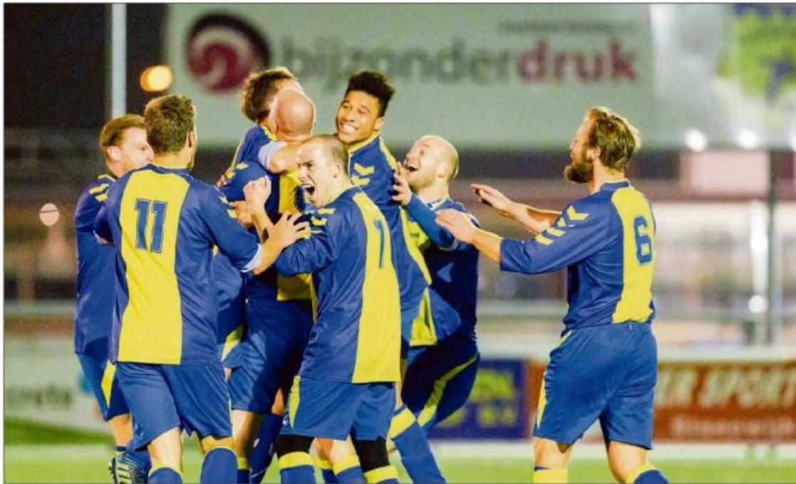
Martijn Bijzitter