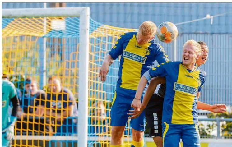
d'Olde Veste'54 moest zaterdag zijn meerdere erkennen in Oranje Nassau.