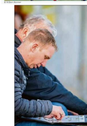
Het is puzzelen voor de trainers.