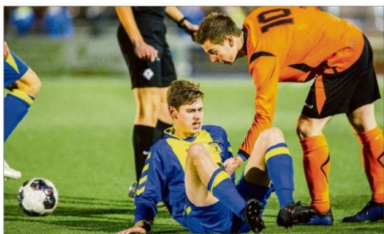
Chalgassenen bieden elkaar de helpende hand.

voren aangegeven bij de vraag of deze wedstrijd voor mij een deal or no deal-spelletje is, dat het keihard