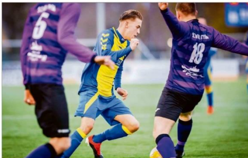
Bedum vs. Olde Veste'54

Geplaatst op zaterdag 1 december 2018 19:15