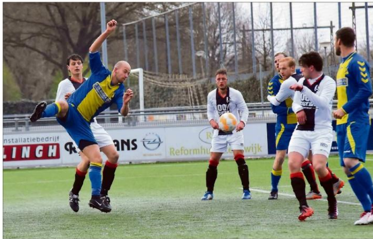
Een gevaarlijk moment in de doelmond van Gorecht.