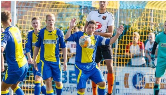
d'Olde Veste'54 hoopt in Groningen weer een driepunten te pakken.

Geplaatst op vrijdag 26 oktober 2018 14:04