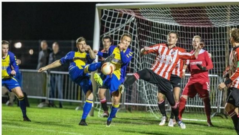
De eerste selectie van d'Olde Veste'54 schakelde vorige week woensdag nog vv Steenwijk uit.

Geplaatst op woensdag 14 november 2018 08:31